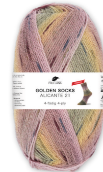
Farbe Nr. 443.02