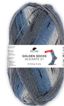
Farbe Nr. 443.11