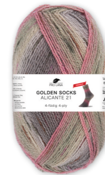
Farbe Nr. 443.06