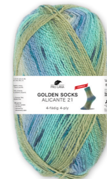
Farbe Nr. 443.05