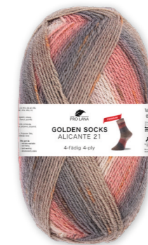
Farbe Nr. 443.08