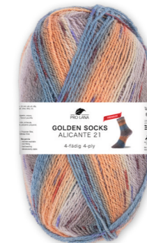
Farbe Nr. 443.03