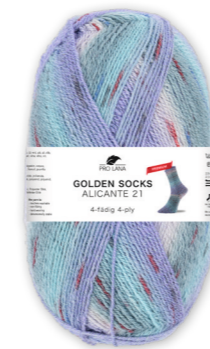
Farbe Nr. 443.01