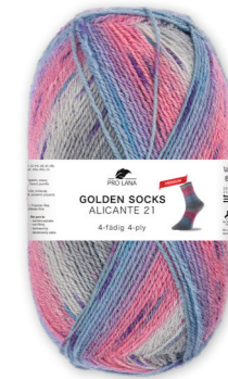
Farbe Nr. 443.04