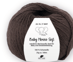
Farbe Nr. 11 dunkelbraun