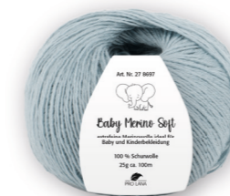
Farbe Nr. 61 jade