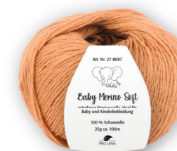
Farbe Nr. 23 fuchs