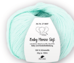
Farbe Nr. 63 mint