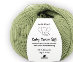
Farbe Nr. 67 khaki