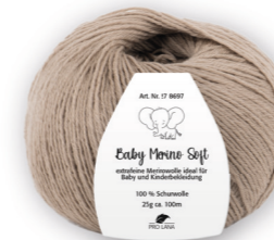
Farbe Nr. 06 beige