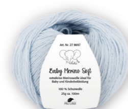
Farbe Nr. 56 hellblau