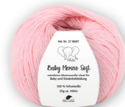
Farbe Nr. 33 rosa