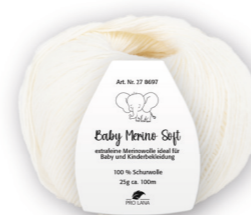
Farbe Nr. 01 weiß