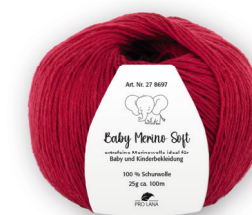
Farbe Nr. 31 weinrot