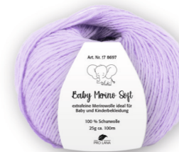
Farbe Nr. 41 flieder