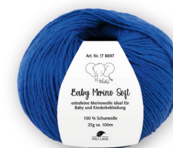
Farbe Nr. 51 royalblau