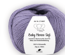
Farbe Nr. 44 pflaume