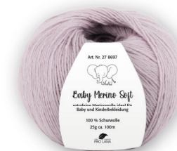
Farbe Nr. 91 nebel