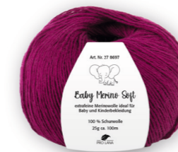
Farbe Nr. 38 bordeaux