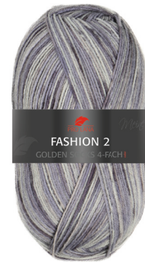
Farbe Nr. E07

Discover our budget-friendly 4-ply yarn that automatically creates striped socks in subtle and harmonious colors. Perfectly suitable for spring and summer, individual dark effects add a special touch to the stripes. With a material blend of 75% fine wool and 25% polyamide, the knitted socks are not only durable and long-lasting but also incredibly cuddly for a comfortable experience for your feet. You can easily wash the finished socks at high temperatures in the washing machine without the material being damaged or felting. Start your knitting adventure for the warm season now!