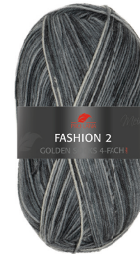
Farbe Nr. E12