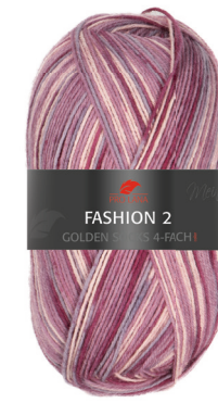
Farbe Nr. E09