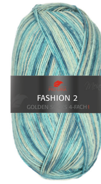
Farbe Nr. E08