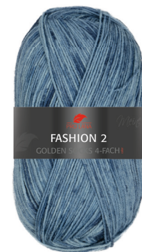
Farbe Nr. E11