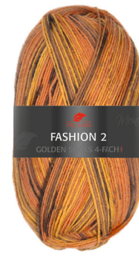
Farbe Nr. E10