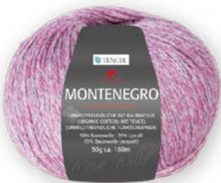
Farbe Nr. 43 pink

50% Baumwolle/Organic Cotton 35% Lyocell 15% Baumwolle (recycelt) Lauflänge 160m/50g Nadelstärke 3,0 – 4,0