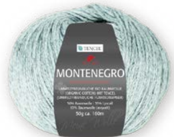
Farbe Nr. 62 gletscher