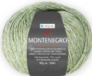
Farbe Nr. 78 khaki