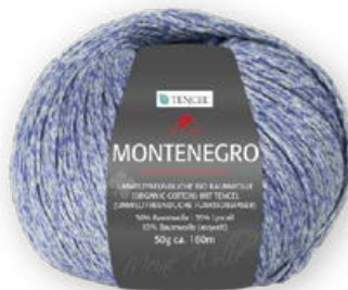
Farbe Nr. 55 jeans