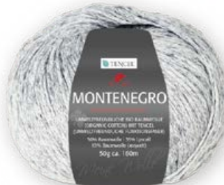
Farbe Nr. 90 silber