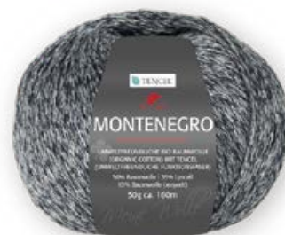
Farbe Nr. 98 graphit