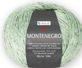
Farbe Nr. 61 mint