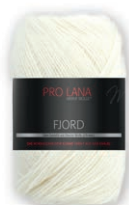
Farbe Nr. 80

70% Schurwolle Merino 30% Polyacryl Lauflänge 350m/100g Nadelstärke 5,5 – 6,5