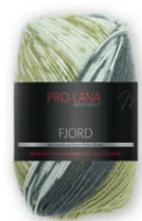
Farbe Nr. 86