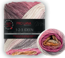
Farbe Nr. 09 rosewood / braun

1 KNÄUEL = LOOP | 2 KNÄUEL = SCHAL | 3 KNÄUEL = TOP/KURZARM PULLI | 4 KNÄUEL = PULLI