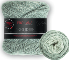
Farbe Nr. 02 gletscher