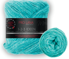
Farbe Nr. 04 türkis