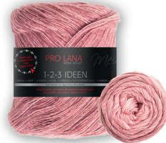
Farbe Nr. 06 granat