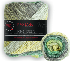
Farbe Nr. 08 grün / gelb