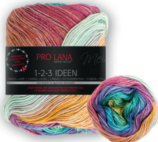
Farbe Nr. 07 rainbow