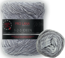
Farbe Nr. 05 grey