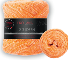
Farbe Nr. 03 orange