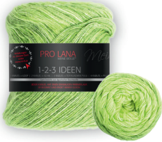
Farbe Nr. 01 green apple

100% Baumwolle Laufänge 315m/100g Nadelstärke 3,0 – 4,0