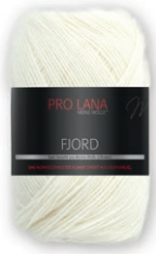
Farbe Nr. 80

70% Schurwolle Merino 30% Polyacryl Lauflänge 350m/100g Nadelstärke 5,5 – 6,5