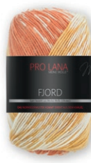
Farbe Nr. 82