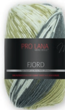
Farbe Nr. 86