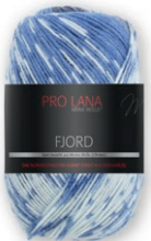
Farbe Nr. 84