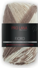
Farbe Nr. 81