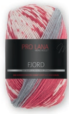
Farbe Nr. 83