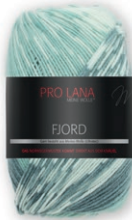
Farbe Nr. 85