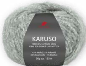
Farbe Nr. 92 grau