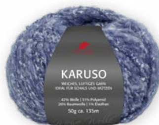
Farbe Nr. 50 marine