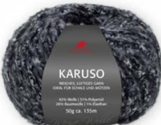
Farbe Nr. 99 schwarz