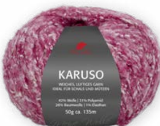
Farbe Nr. 39 bordeaux