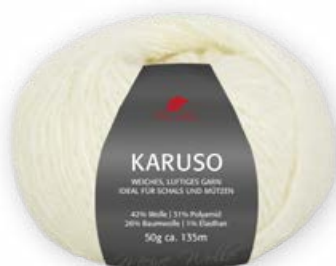
Farbe Nr. 02 natur

42% Wolle 31% Polyamid 26% Baumwolle 1% Elasthan Lauflänge 135m/50g Nadelstärke 5,0 – 6,0