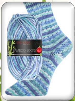
Farbe Nr. 956 blau color

63% Polyacryl (Microfaser) 30% Viskose (Bambus) 7% Polyester (Elité) Laufänge 400m/100g Nadelstärke 2,5 – 3,0