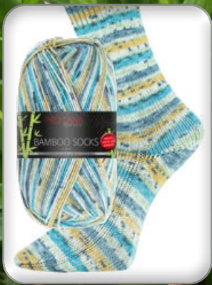
Farbe Nr. 960 türkis/senf color