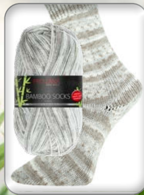
Farbe Nr. 958 taupe color