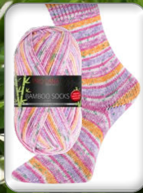
Farbe Nr. 962 pink/flieder color