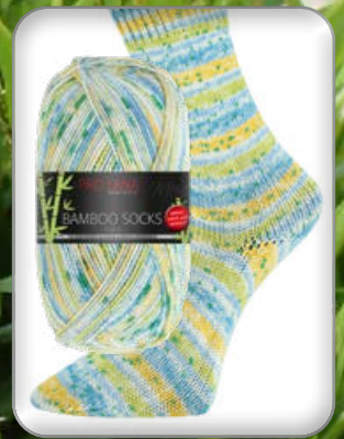
Farbe Nr. 963 gelb/grün color