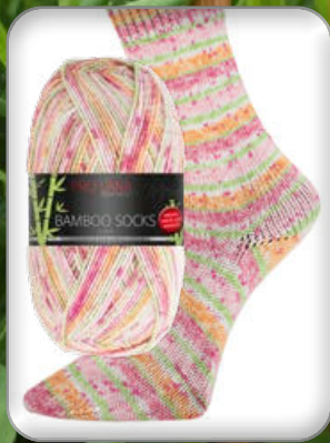
Farbe Nr. 961 mandarin color