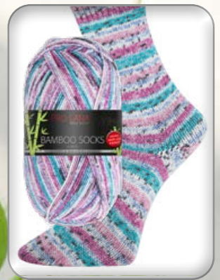
Farbe Nr. 959 fuchsia/türkis color