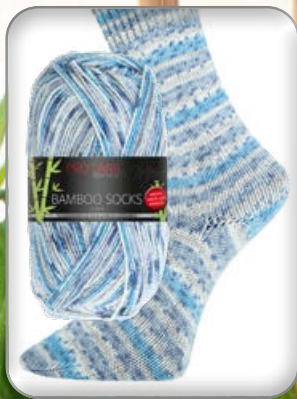
Farbe Nr. 957 hellblau color