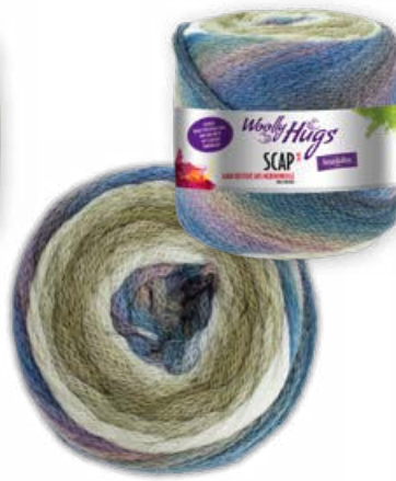
Farbe Nr. 382 grün color