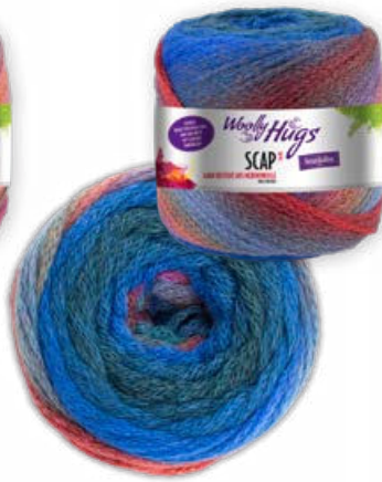
Farbe Nr. 385 royal color