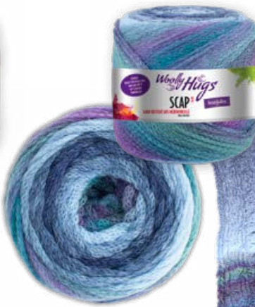
Farbe Nr. 386 hellblau color