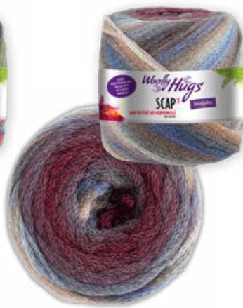
Farbe Nr. 381 bordeaux color