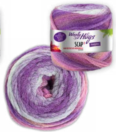
Farbe Nr. 383 lila color