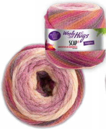
Farbe Nr. 384 rosa color