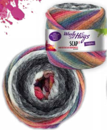
Farbe Nr. 380 schwarz color

90% Schurwolle (Merino) Mulesingfrei 10% Polyamid Lauflänge 480m/240g Nadelstärke 5,0 – 6,0