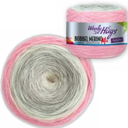
Farbe Nr. 706 puder/natur