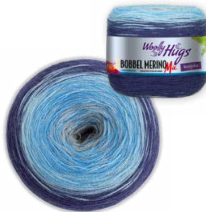
Farbe Nr. 708 hellblau/marine