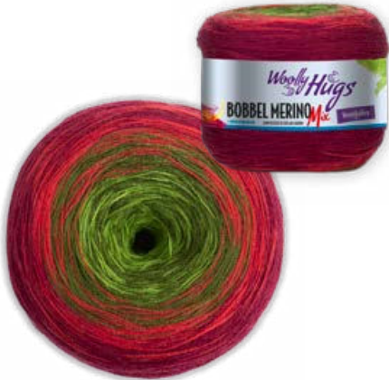
Farbe Nr. 701 * rot/grün

Das 4-fädig gefachte Garn wechselt stets in gleichmäßigen Abständen einen einzelnen Faden. Die traumhaften Farbverläufe entstehen durch das Anknöten der einzelnen Fäden im fließenden Verlauf. Im fertigen Modell sind diese Miniknoten kaum sichtbar. Jeder BOBBEL kann von innen nach außen oder umgekehrt gearbeitet werden.