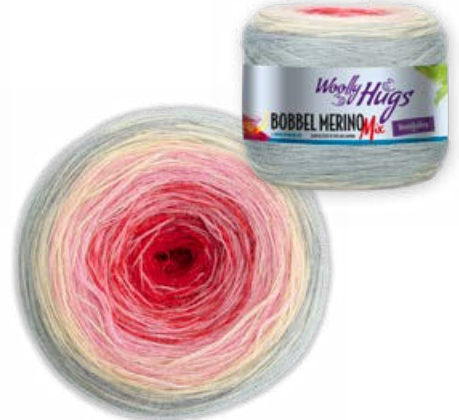
Farbe Nr. 705 * grau/rosa