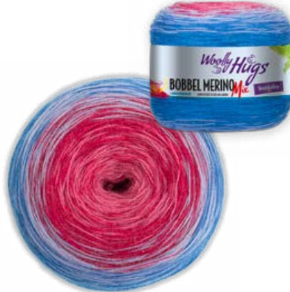
Farbe Nr. 703 blau/koralle