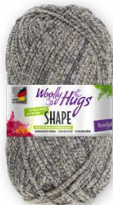
Farbe Nr. 12 sand