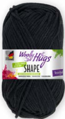
Farbe Nr. 99 schwarz