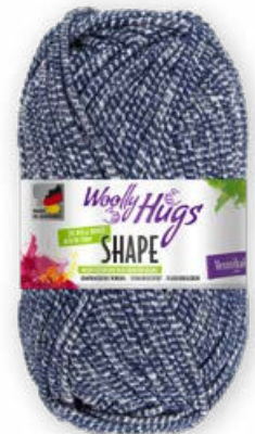
Farbe Nr. 54 denim