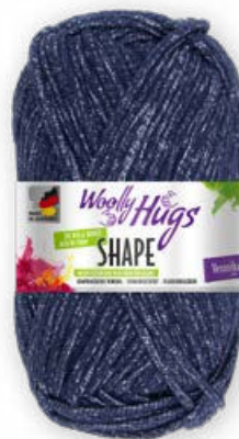
Farbe Nr. 50 marine