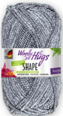
Farbe Nr. 90 hellgrau