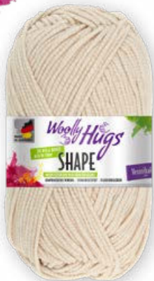
Farbe Nr. 05 haut

70% Polyamid 30% Elasthan Lauflänge 165m/50g Nadelstärke 3,0 – 3,5