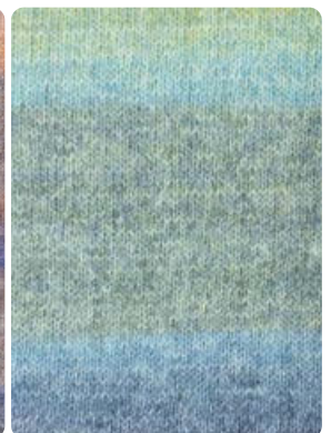
Farbe Nr. 84