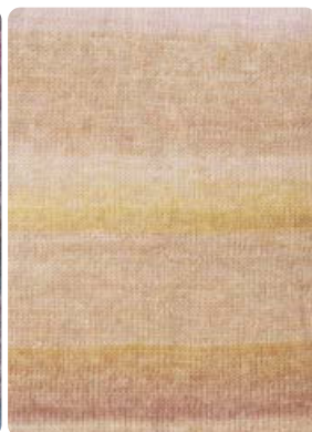
Farbe Nr. 82