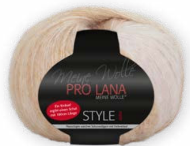
Farbe Nr. 82 gelb/orange