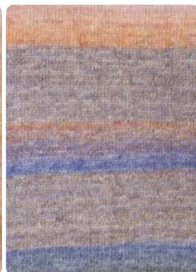
Farbe Nr. 83