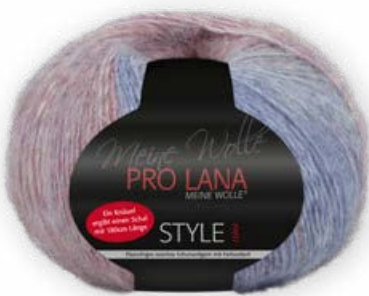
Farbe Nr. 80 rot/blau/pflaume

75% Schurwolle 25% Polyamid Lauflänge 370m/150g Nadelstärke 5,0 – 6,0