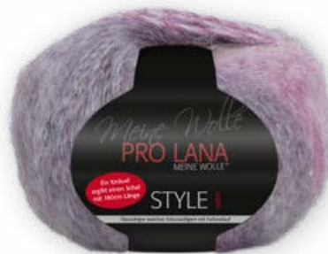
Farbe Nr. 81 pink/blau/pflaume