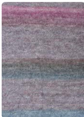
Farbe Nr. 81