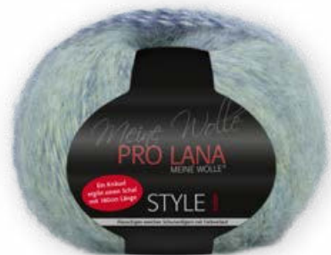
Farbe Nr. 84 petrol/grün/gelb

Ein Knäuel ergibt einen Schal mit 180cm Länge