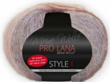
Farbe Nr. 83 orange/blau