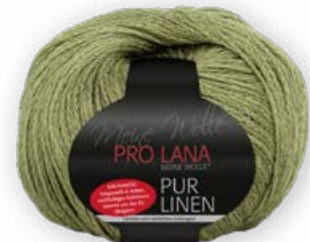
Farbe Nr. 72 oliv