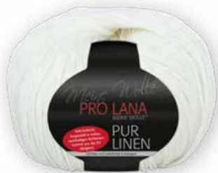
Farbe Nr. 02 natur

100% Leinen Lauflänge 160m/50g Nadelstärke 4,5 – 5,5