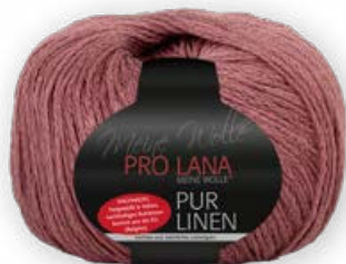
Farbe Nr. 28 terracotta