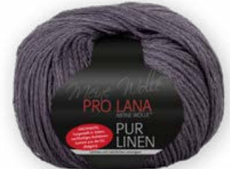
Farbe Nr. 49 aubergine