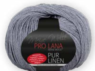
Farbe Nr. 97 grau