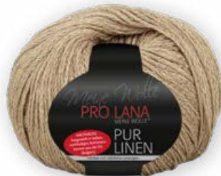
Farbe Nr. 08 sand