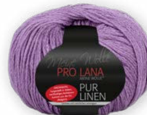
Farbe Nr. 47 violett