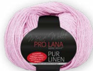
Farbe Nr. 33 rosa