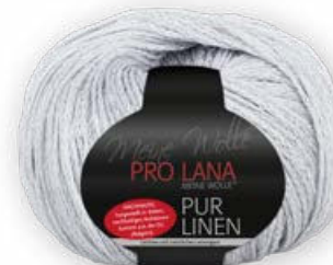
Farbe Nr. 91 nebel