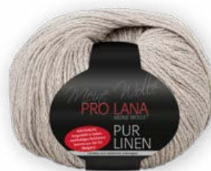
Farbe Nr. 18 nude