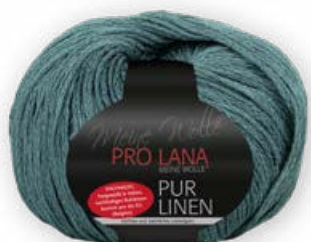
Farbe Nr. 69 petrol