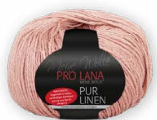
Farbe Nr. 25 rosewood