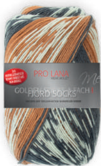
Farbe Nr. 187 curry color