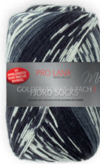
Farbe Nr. 190 grau color