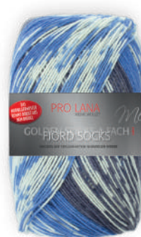
Farbe Nr. 184 blau color