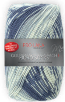
Farbe Nr. 191 marine color