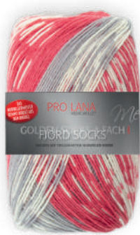
Farbe Nr. 183 rot color