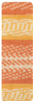
Farbe Nr. 182