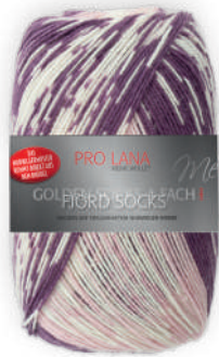
Farbe Nr. 188 pflaume color