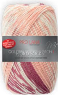
Farbe Nr. 189 bordeaux color