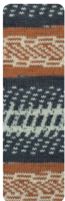
Farbe Nr. 187