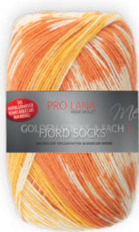
Farbe Nr. 182 gelb color