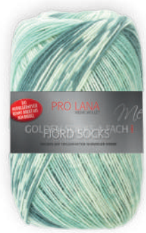
Farbe Nr. 185 mint color