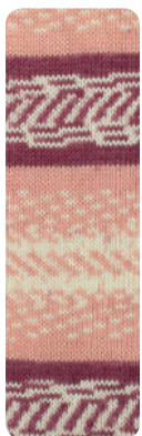
Farbe Nr. 189