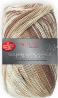
Farbe Nr. 181 beige color