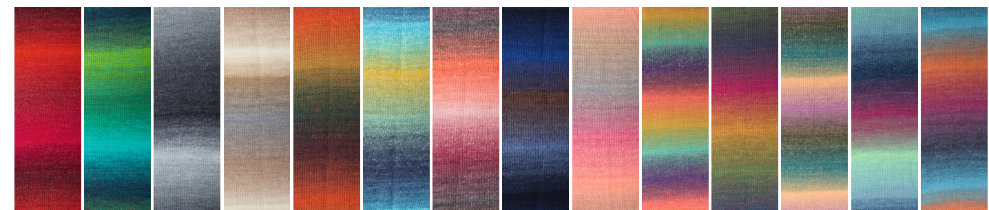
Farbe 83 rot Farbe 86 grün Farbe 87 grau Farbe 88 grau/beige Farbe 89 orange/lila Farbe 90 gelb/blau Farbe 91 beere/orange Farbe 92 blau/braun Farbe 93 rosa/grau Farbe 94 türkis/lila/orange Farbe 95 grün/gelb/weinrot Farbe 96 flieder/petrol/vanille Farbe 97 mint/weinrot/jeans Farbe 98 türkis/blau/orange