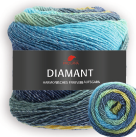
Farbe Nr. 90 gelb/blau