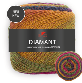
Farbe Nr. 95 grün/gelb/weinrot