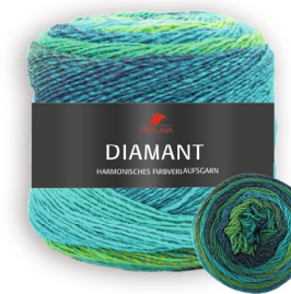
Farbe Nr. 86 grün