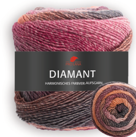
Farbe Nr. 91 beere/orange