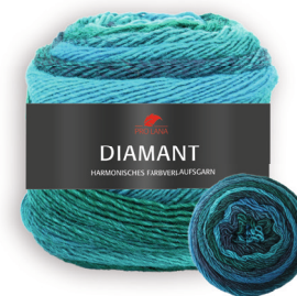
Farbe Nr. 80 türkis