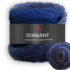
Farbe Nr. 92 blau/braun