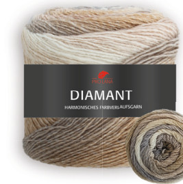
Farbe Nr. 88 grau/beige