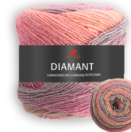
Farbe Nr. 93 rosa/grau