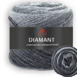
Farbe Nr. 87 grau