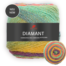
Farbe Nr. 94 türkis/lila/orange