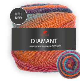
Farbe Nr. 98 türkis/blau/orange