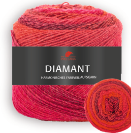
Farbe Nr. 83 rot