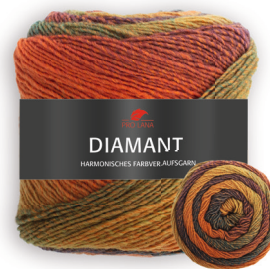
Farbe Nr. 89 orange/lila