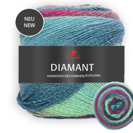
Farbe Nr. 97 mint/weinrot/jeans