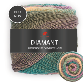
Farbe Nr. 96 flieder/petrol/vanille