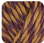
Farbe Nr. 86