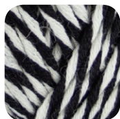
Farbe Nr. 81