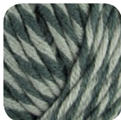
Farbe Nr. 87