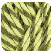
Farbe Nr. 82