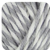
Farbe Nr. 80

50% Schurwolle Merino Wolle 50% Polyacryl 50g Knäuel Lauflänge 55m/50g Nadelstärke 7,0 – 8,0