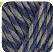
Farbe Nr. 85