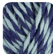
Farbe Nr. 84