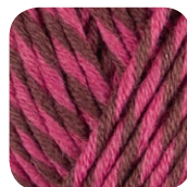
Farbe Nr. 83