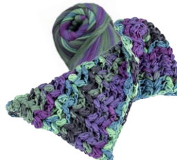
Farbe Nr. 07