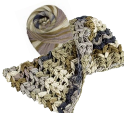
Farbe Nr. 10