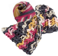
Farbe Nr. 06