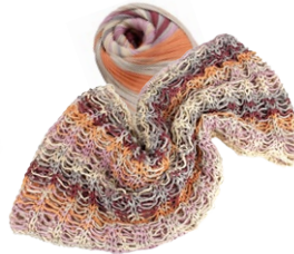
Farbe Nr. 03