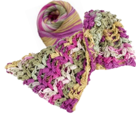
Farbe Nr. 04