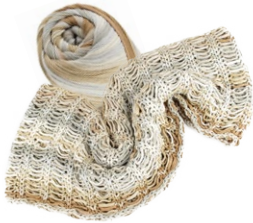
Farbe Nr. 01

Weitere Farben befinden sich auf der Innenseite