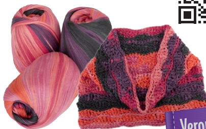
Farbe Nr. 13

Anleitungs-Video auf YouTube: https://youtu.be/zrsgNMbX9Xc