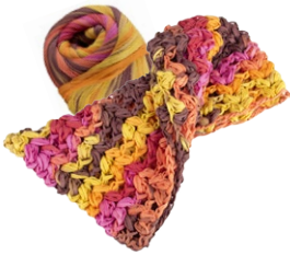
Farbe Nr. 05