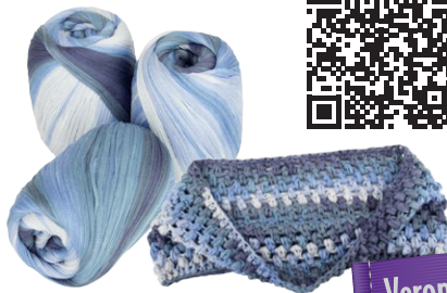
Farbe Nr. 12

Abschlussrunde: Nach 11 Runden mit Büschelmaschen noch 1 Runde mit 80 halben Stäbchen häkeln, dann enden.