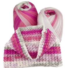
Farbe Nr. 15