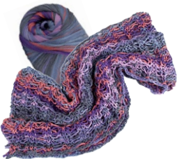
Farbe Nr. 09