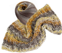
Farbe Nr. 02