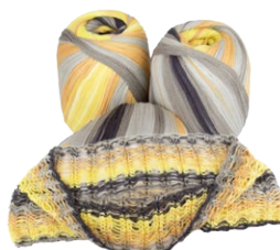
Farbe Nr. 14