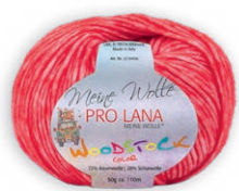
Farbe Nr. 30 rot