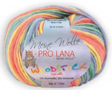
Farbe Nr. 81 grün / blau / gelb / rot