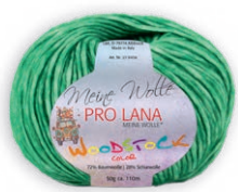
Farbe Nr. 70 grün