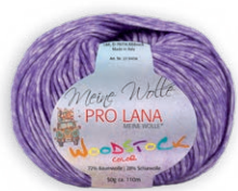
Farbe Nr. 45 flieder