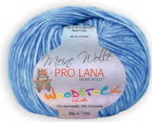
Farbe Nr. 51 royal