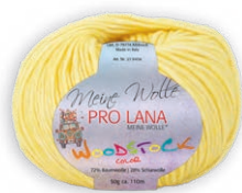
Farbe Nr. 21 gelb

72% Baumwolle 28% Schurwolle Lauflänge 110m/50g Nadelstärke 4,5 – 5,5