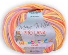
Farbe Nr. 80 orange / flieder / gelb / rot