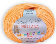
Farbe Nr. 28 orange