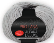
Farbe Nr. 92 grau