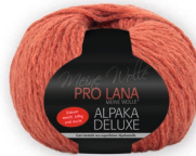
Farbe Nr. 28 rost