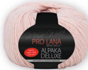
Farbe Nr. 37 alrosé