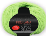
Farbe Nr. 74 kiwi