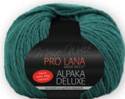
Farbe Nr. 68 petrol