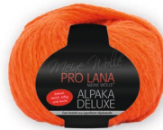
Farbe Nr. 26 ziegel