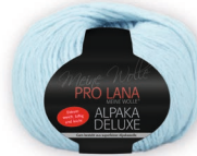
Farbe Nr. 57 hellblau