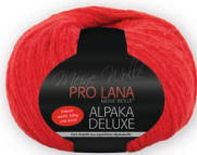
Farbe Nr. 30 rot