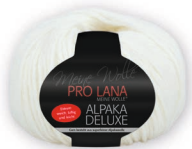
Farbe Nr. 02 natur

63% Alpaka 37% Polyamid Laufflänge 150m/50g Nadelstärke 4,5 – 5,5