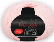
Farbe Nr. 33 rosa