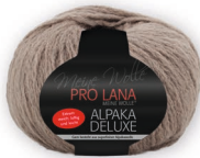
Farbe Nr. 12 taupe