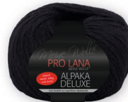
Farbe Nr. 99 schwarz