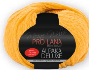
Farbe Nr. 22 gelb