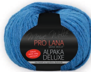
Farbe Nr. 55 jeans