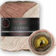
Farbe Nr. 11 wüste