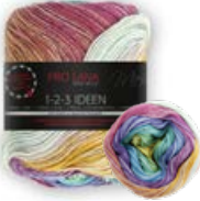
Farbe Nr. 07 rainbow