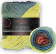
Farbe Nr. 13 herbst