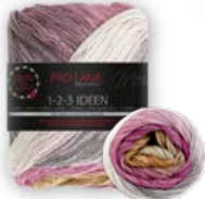
Farbe Nr. 09 rosewood / braun