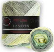
Farbe Nr. 08 grün / gelb