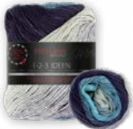
Farbe Nr. 10 ozean