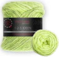
Farbe Nr. 01 green apple

100% Baumwolle Lauffänge 315m/100g Nadelstärke 3,0 – 4,0