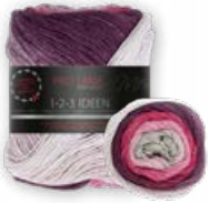
Farbe Nr. 12 frucht