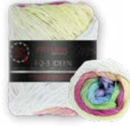
Farbe Nr. 14 sommer

1 KNÄUEL = LOOP | 2 KNÄUEL = SCHAL | 3 KNÄUEL = TOP/KURZARM PULLI | 4 KNÄUEL = PULLI