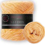
Farbe Nr. 03 orange