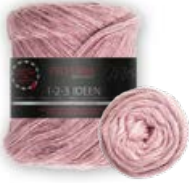
Farbe Nr. 06 granat

Der Farbverlauf beginnt und endet immer gleich.