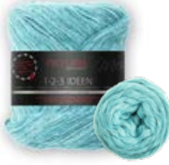
Farbe Nr. 04 türkis