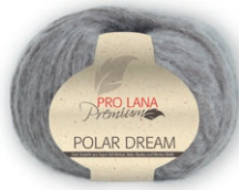
Farbe Nr. 18 sand