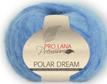
Farbe Nr. 55 himmel