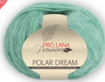
Farbe Nr. 61 hellgrün