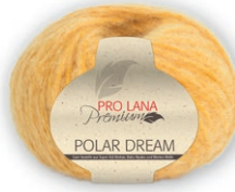
Farbe Nr. 22 gelb