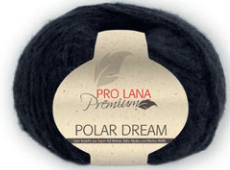
Farbe Nr. 99 schwarz