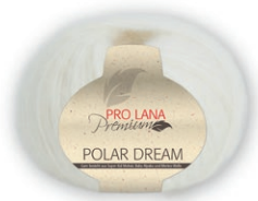
Farbe Nr. 02 natur