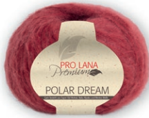
Farbe Nr. 31 rot