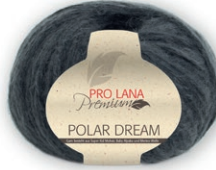
Farbe Nr. 97 anthrazit