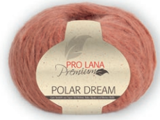
Farbe Nr. 27 ziegel