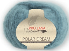
Farbe Nr. 15 petrol